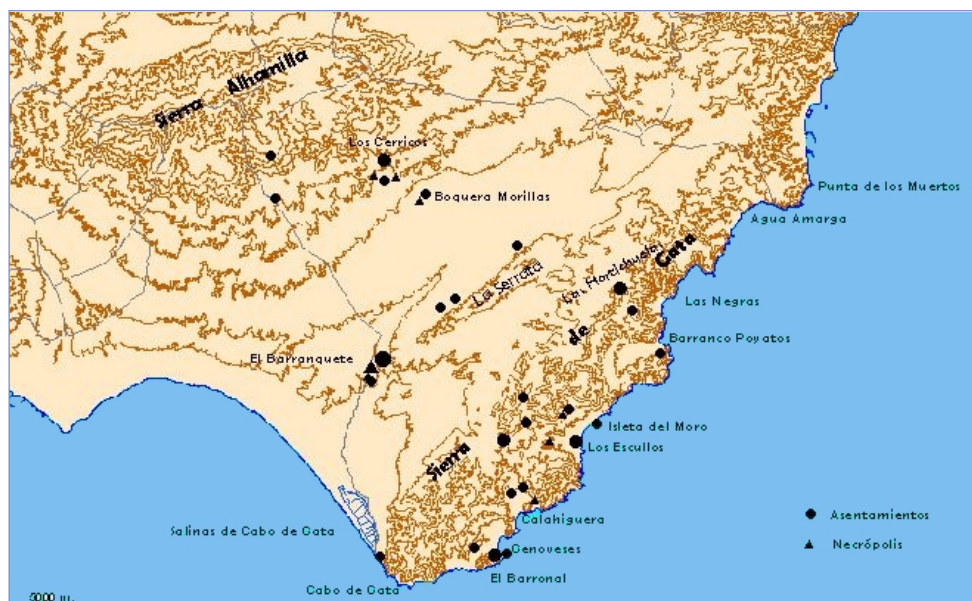
Distribución de asentamientos y necrópolis durante el III milenio a.n.e.

Sobre la parte más oriental de la Sierra de Cabo de Gata destacamos otra área geográfica que incluye desde la Rambla del Playazo hasta la Rambla de Las Negras. A grandes rasgos el área se asienta sobre terrenos de origen volcánico en el que dominan las dacitas y las andesitas, las brechas piroclásticas de dacitas y andesitas, así como zonas de aluvión y coluvión de arenas, limos y cantos. También aparecen documentados algunos afloramientos metálicos de oro y plata.