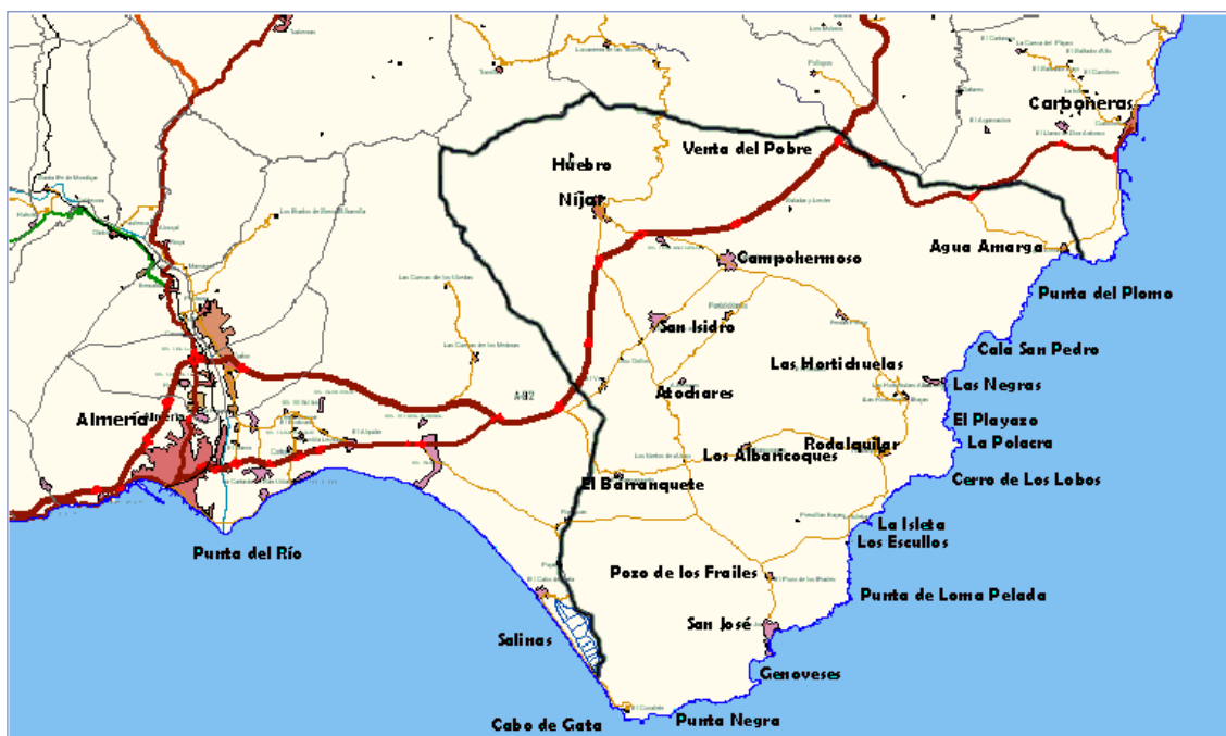
Localización del área de estudio.

La Rambla del Hornillo forma otra unidad situada entre la Serrata y la Sierra de Gata que desemboca en la Rambla Morales a la altura de El Barranquete. Los materiales pertenecen al Neógeno-Cuaternario y están compuestos por arcillas y cantos de origen volcánico. Desde el Barranquete hasta la desembocadura la rambla Morales se abre progresivamente hacia el mar, observándose pequeñas elevaciones que dominan el paisaje a uno y otro lado de la rambla.