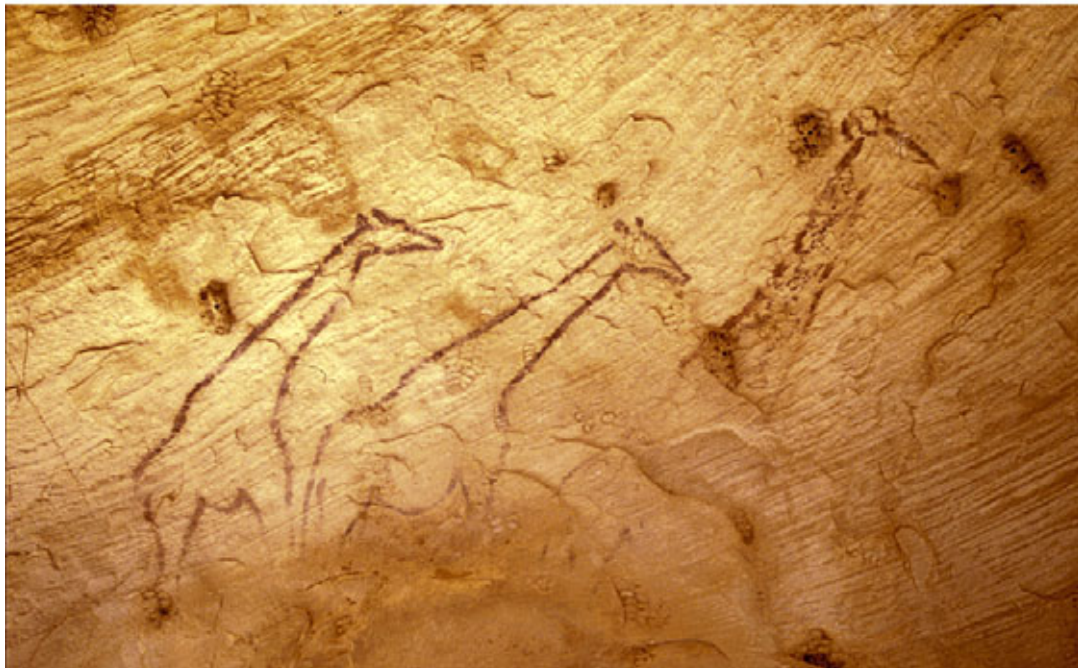
Fig. 2. Algunos ejemplos de pinturas rupestres del Sector Este