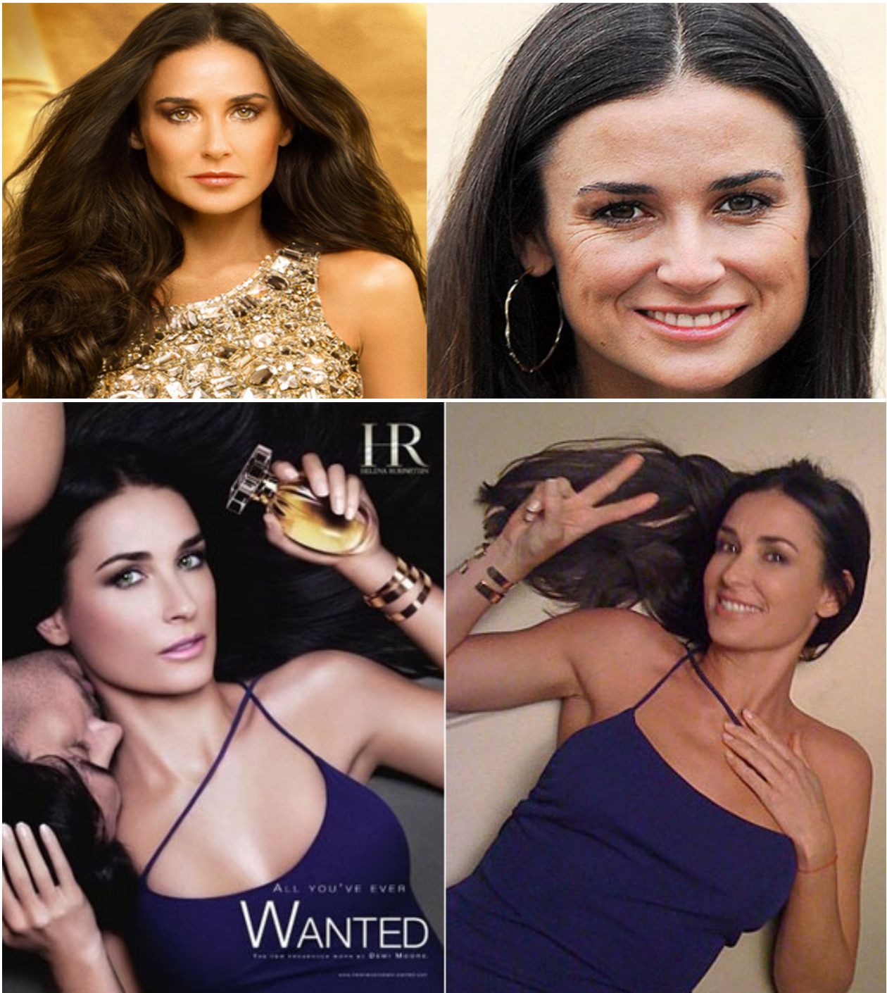
Imagen 3. Publicidad protagonizada por la actriz Demi Moore, cuando contaba con 50 años de edad e imagen no manipulada de la actriz.

En la publicidad de la imagen 3 se observa que para realzar la belleza del rostro se ha modificado el contorno del rostro de la actriz que se alarga. Con el filtro licuar se le ha suavizado la barbilla, afinado la nariz, y levantado la punta de esta hacia arriba al igual que las cejas. Con el mismo filtro se han engordado los labios de forma suave y, se han