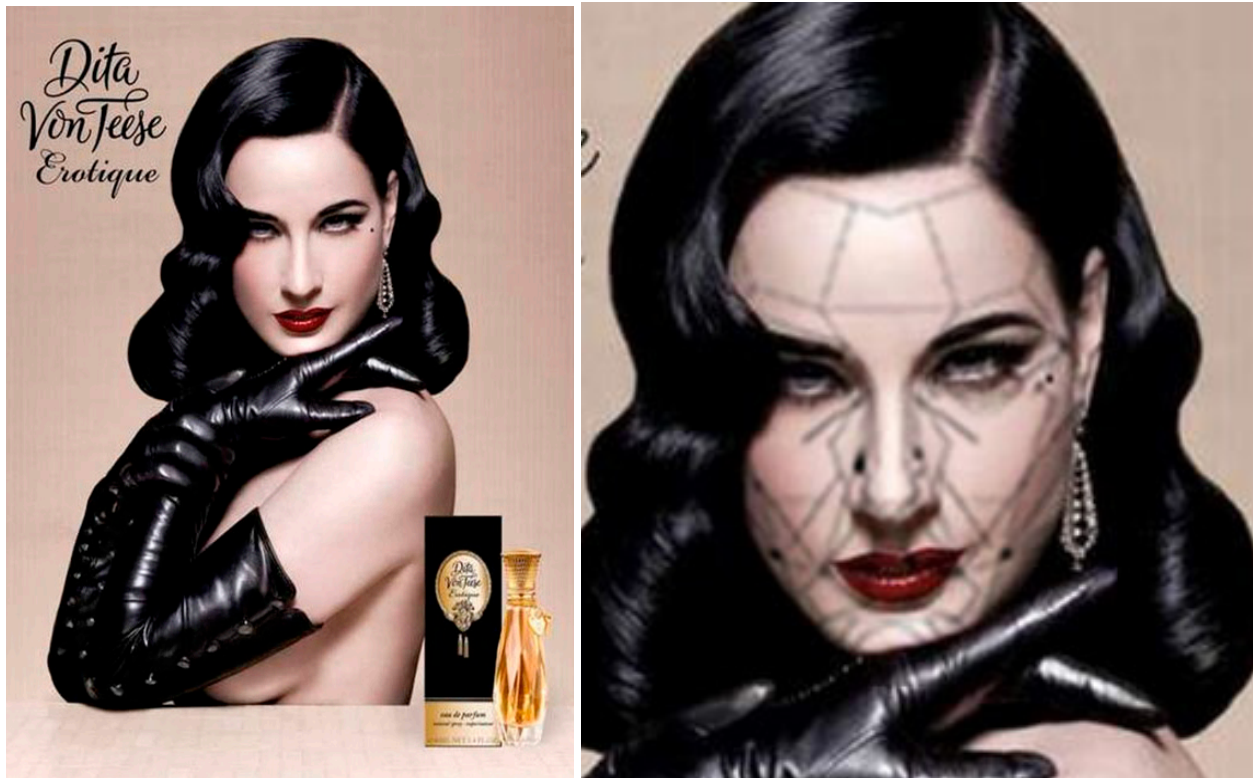
Imagen 1. Ejemplo de la aplicación de la máscara del Dr. Stephen Marquardt en Photoshop .

También, se realizó un análisis cuantitativo para conocer qué porcentaje de imágenes estaban retocadas digitalmente y cuáles eran los retoques más utilizados. Además de un análisis cualitativo para analizar el contenido adaptado a las variables que determinan el canon de belleza del estudio de las muestras del artículo: raza o etnia, juventud, belleza del rostro y delgadez. Estas variables son a su vez conceptos estéticos identificados con el canon de belleza actual defendidos por autores como Prüssing y Salazar (2009), Moya (2010), Bernard Monferrer (2010), Maluenda Toledo (2010), Velásquez Fernández (2013), o López Pérez (2009).