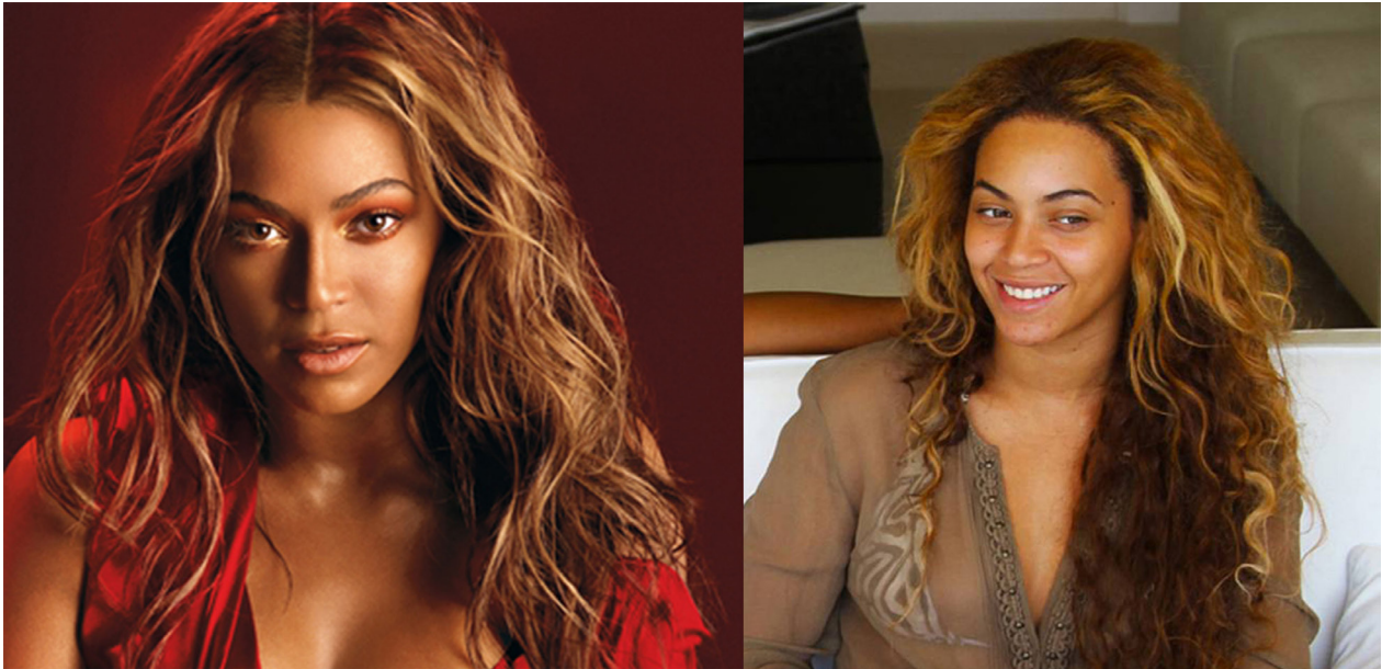
Imagen 2. Imagen retocada y sin retocar de la cantante Beyoncé.