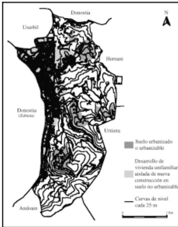
FIGURA 1. VIVIENDA UNIFAMILIAR AISLADA EN EL SUELO NO URBANIZABLE DE LASARTE-ORIA. AÑO 2000