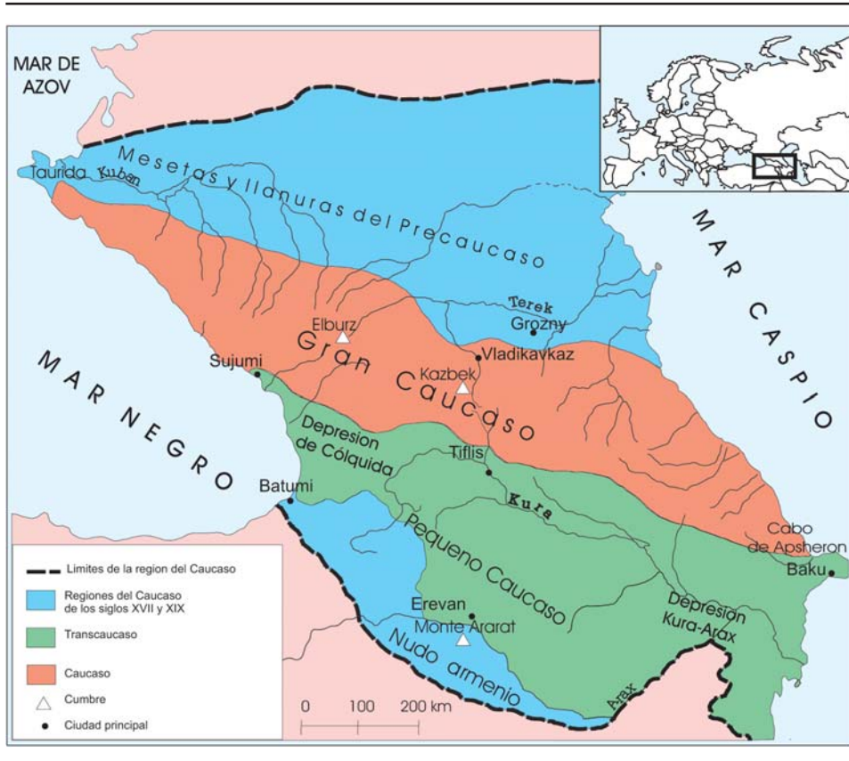
Mapa 1. Las regiones del Cáucaso según mapas y textos de los siglos XVIII, XIX y XX