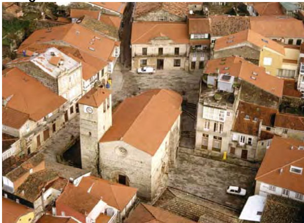
Fotografía ilustrativa del casco histórico