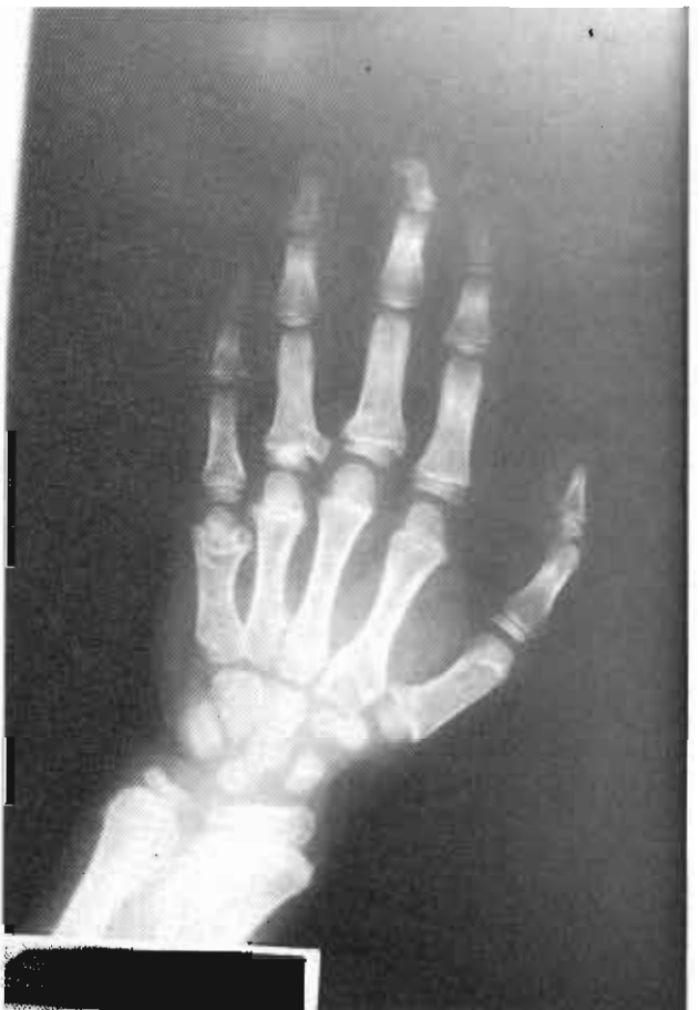
Figura 5. Exóstosis en 3ª falange del tercer dedo.

Exploración física: niño varón con un peso de 30,5 Kg (p50) y 132 cm de talla (p25). Pigmentación oscura de piel de origen racial. Simetría de pliegues inguinales y ensanchamiento a nivel de ambas muñecas y a nivel tibia distal bilateral. Por palpación se evidencian nódulos de tamaño variable, consistencia ósea y adheridos al plano óseo a nivel humeral proximal, escapular derecho, costal, tibioperoneos bilaterales y falange distal de tercer dedo de la mano izquierda. Tensión arterial 125/60. Auscultación cardiorespiratoria, palpación abdominal e inspección de orofaringe normales. No se evidencian dismorfias faciales.