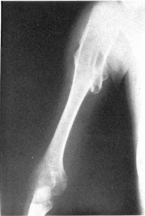
Figura 3. Exóstosis humerales.