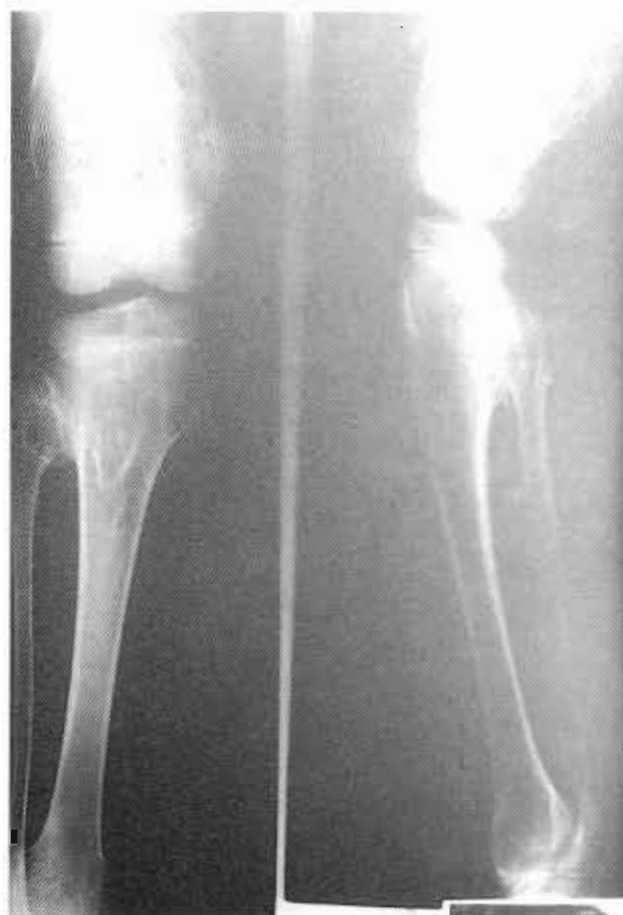
Figura 2. Exóstosis tibio-peroneas.

La enfermedad de las exóstosis múltiples cartilaginosa se transmite como un rasgo autosómico dominante y se caracteriza por la existencia de excrecencias óseas pediculadas de crecimiento excéntrico que originan deformidades óseas secundarias. A diferencia de las endondromatosis o condromatosis internas, tienen tendencia a la afectación bilateral aunque de forma no completamente simétrica. Las exóstosis se advierten como tumoraciones delimitadas no dolorosas y firmemente adheridas al hueso subyacente. En ocasiones pueden originar disfunciones mecánicas derivadas de