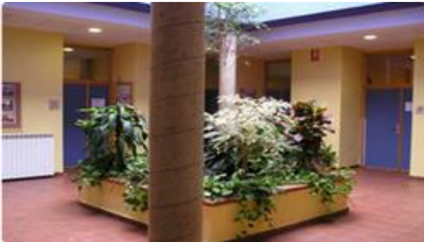
Patio andaluz como lugar de encuentro con las familias