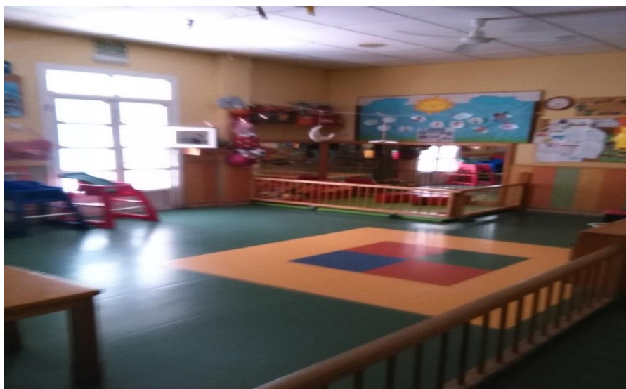
Aula cielo- nubes niños de 0-1 y 1-2 años.