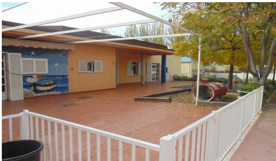
Patio para niños de 3-4 años.