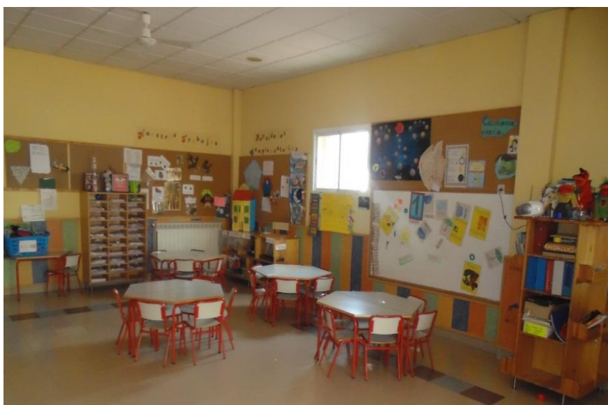
Aula luna para niños/as de 4-5 años.