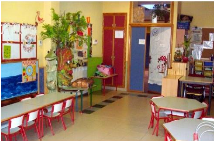
Aula aire: para niños de 3-4 años