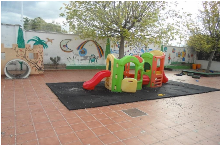
Patios para niños de 4-5 años.