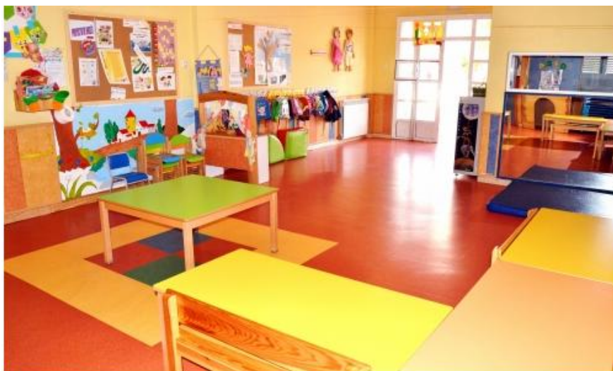
Aula sol niños de 2-3 años.