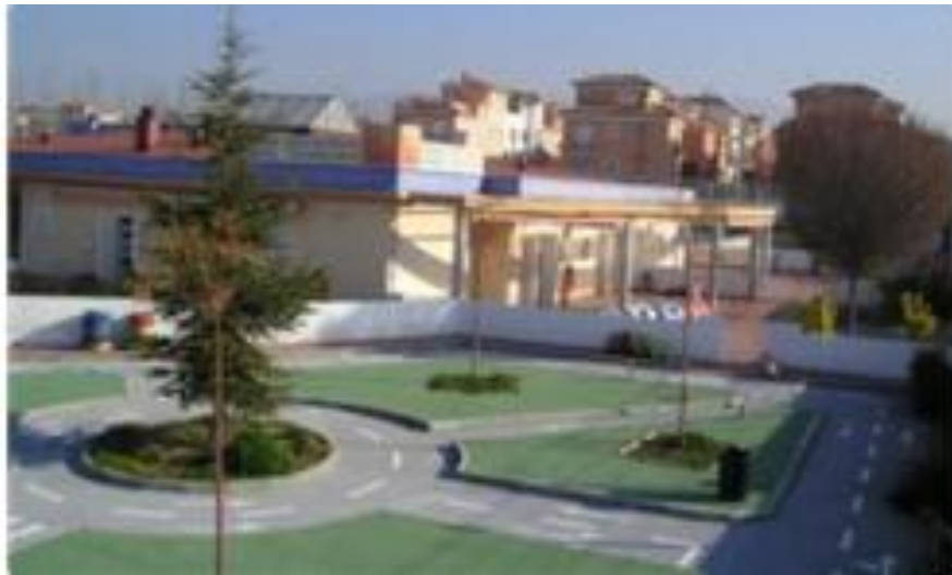
Pista Educación vial