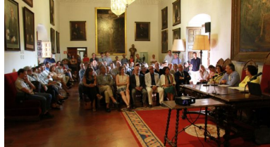
Público asistente a la presentación

Evolución de la web de la Universidad de Granada