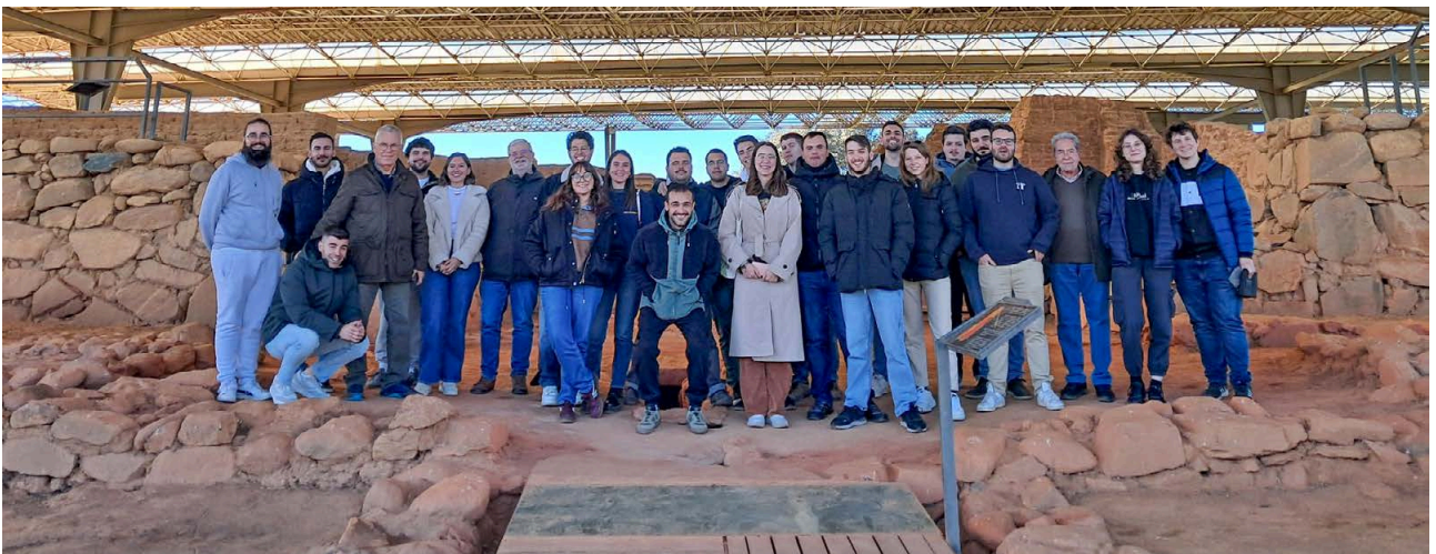
12. Visita a Cancho Roano