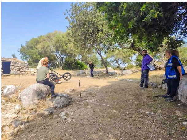
01. Prácticas de geofísica