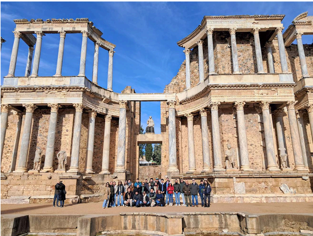
14. Visita a Mérida