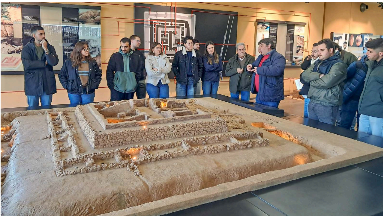
11. Visita a Cancho Roano