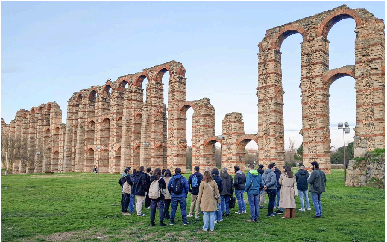
13. Visita a Mérida