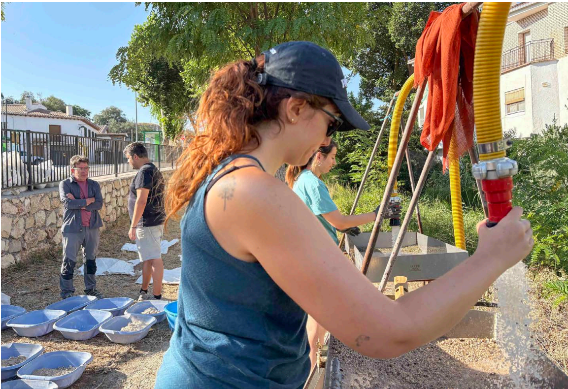
06. Prácticas en Orce