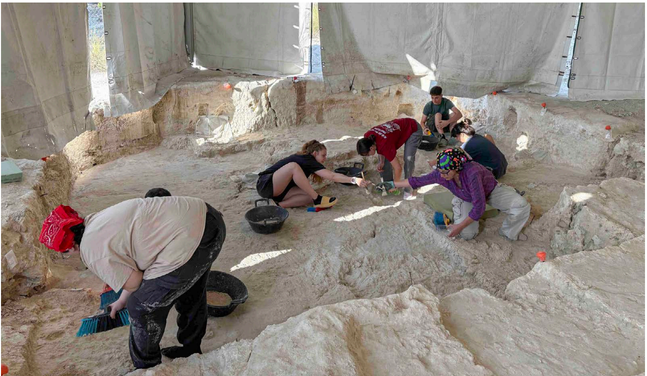
05. Prácticas en Orce