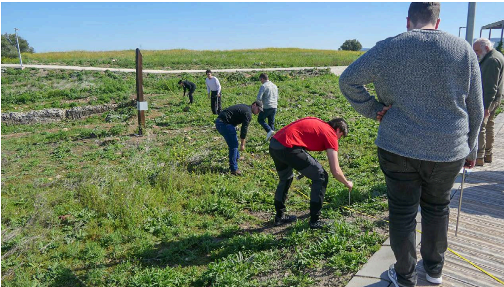
04. Prácticas de tomografía eléctrica en Cástulo.