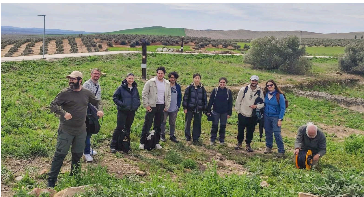
03. Prácticas de tomografía eléctrica en Cástulo