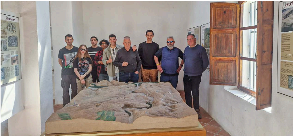
15. Visita a Los Millares